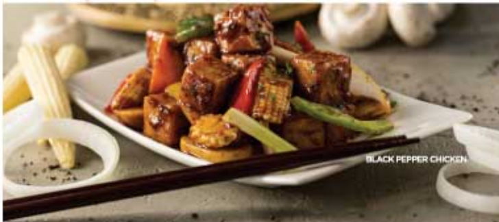
BLACK PEPPER CHICKEN

Lemon Garlic Chili شطة بالليمون والفلفل Ginger & Scallion الجزير و بصل أخضر