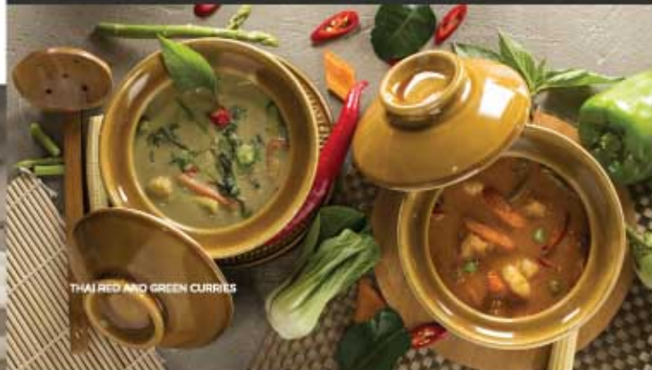
THAI RED AND GREEN CURRIES