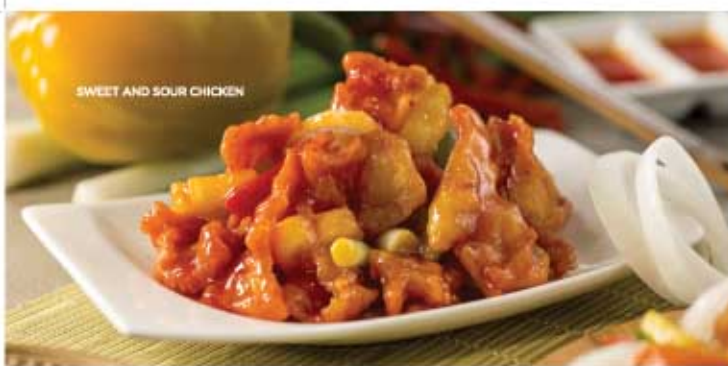
SWEET AND SOUR CHICKEN