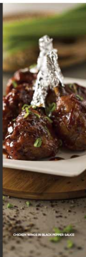
CHICKEN WINGS IN BLACK PEPPER SAUCE